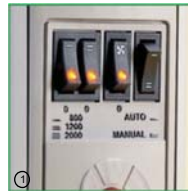
1. Podsvietené ovládacie prepínače.