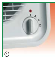
1. Ovládací prepínač