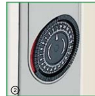
2. Časový spínač nastaviteľný v 15 minútových cykloch. (Caldoré RT)