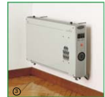
3. Možnosť montáže na stenu.